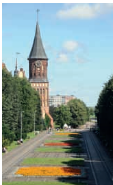
Katedralen från 1300-talet, Kneiphof island, Kaliningrad.