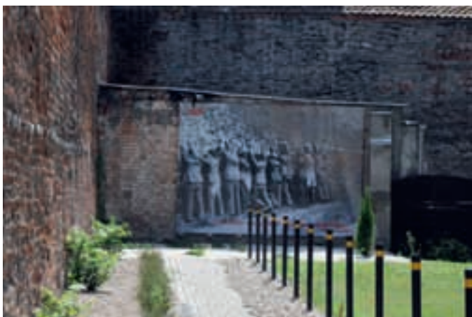
Makabra krigsminnen, Gdansk.