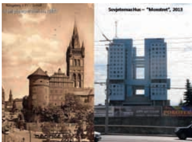
Königsberger Schloss & Sovjetbygget.