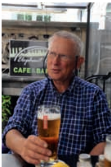
J-G med en svalkande öl i värmen, Gdansk.