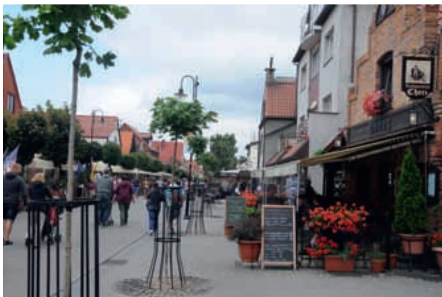
Turistliv i Hel.