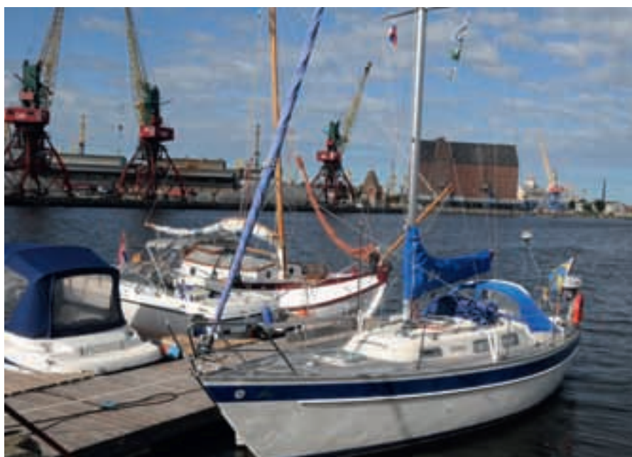
Johanna II i Fishbot marina, Kaliningrad.

Kaliningrad är en rysk exklav, inklämd mellan Polen och Litauen. Det finns efter Sovjetunionens upplösning ingen direkt landförbindelse med egentliga Ryssland. Efter andra världskriget