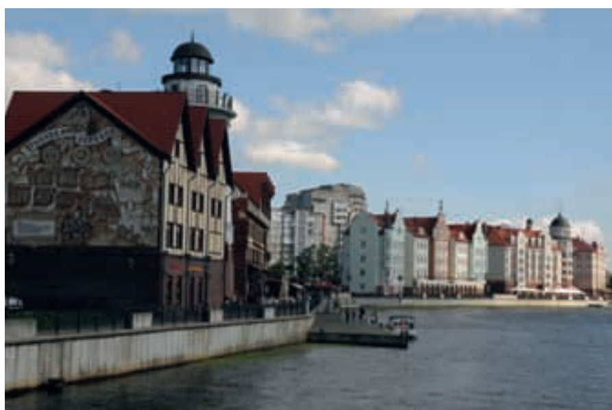
Fishing village, Lomse island, Kaliningrad, med prydliga hus och bra restauranger.

delades det tidigare Ostpreussen upp mellan Polen och Ryssland. Den gamla residensstaden Königsberg omvandlades snabbt till en sovjetisk mönsterstad – Kaliningrad. Huvuddelen av den ryska östersjöflottan är stationerad i Baltijsk, vid inloppet från Östersjön. Tidigare mycket hemligt, Kaliningrad var helt slutet för omvärlden fram till 1991. Från Baltijsk går man Kaliningradskiy Morskoy Kanal som är en 23 M muddrad kanal, över inhavet Kaliningradskiy Zaliv (Frisches Haff – fast vattnet ser nu inte så friskt ut!) sen mellan smala långsträckta öar och slut-