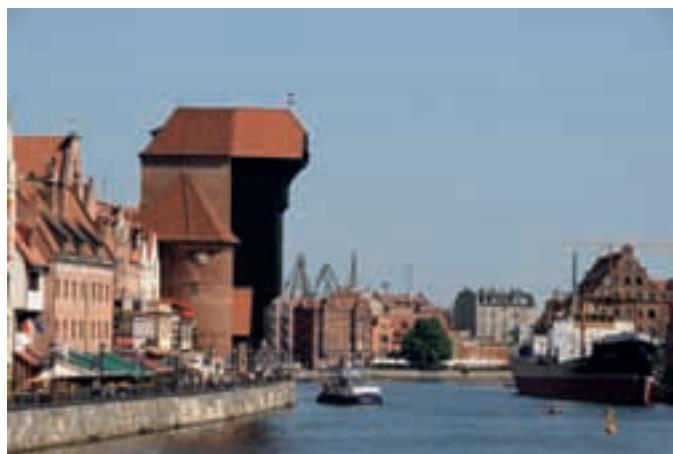
Kranen i Gdansk.