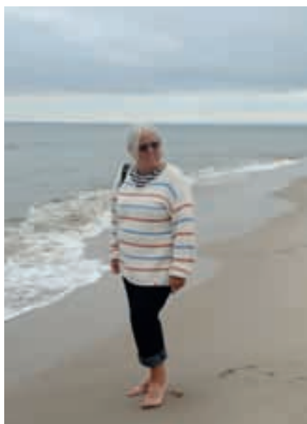
Den långa sandstranden, Hel, Polen.