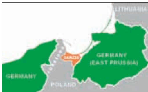
Fristaden Danzig och Polska Korridoren under mellankrigsperioden.