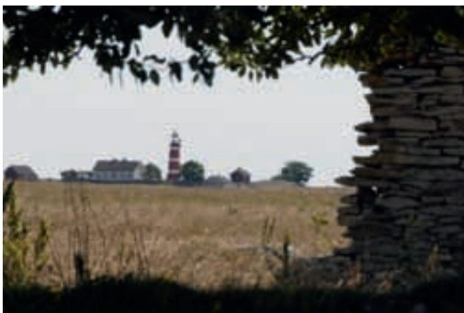
När, östra Gotland.

Polen och Gdansk har en dramatisk historia genom århundraden. Under mellankrigsperioden var Danzig en självständig så kallad fristad (Freie ►