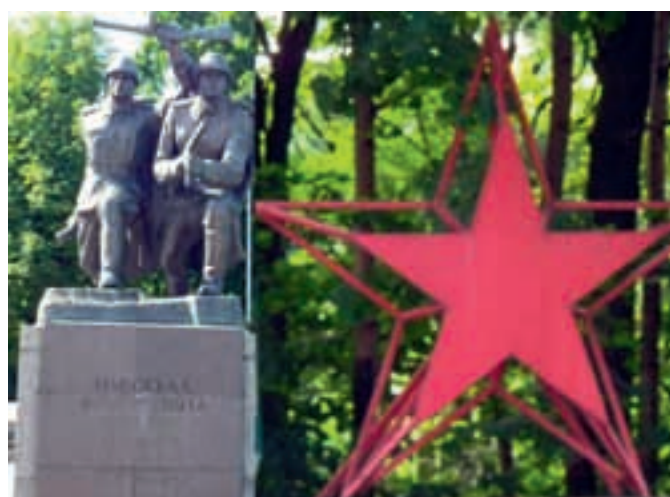
Monument & Röda stjärnan.